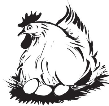
Eier legen und brüten