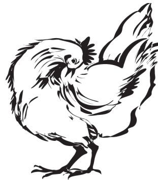
sich putzen (Gefiederpflege)