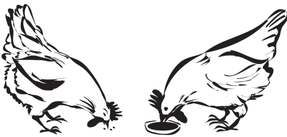
fressen und trinken